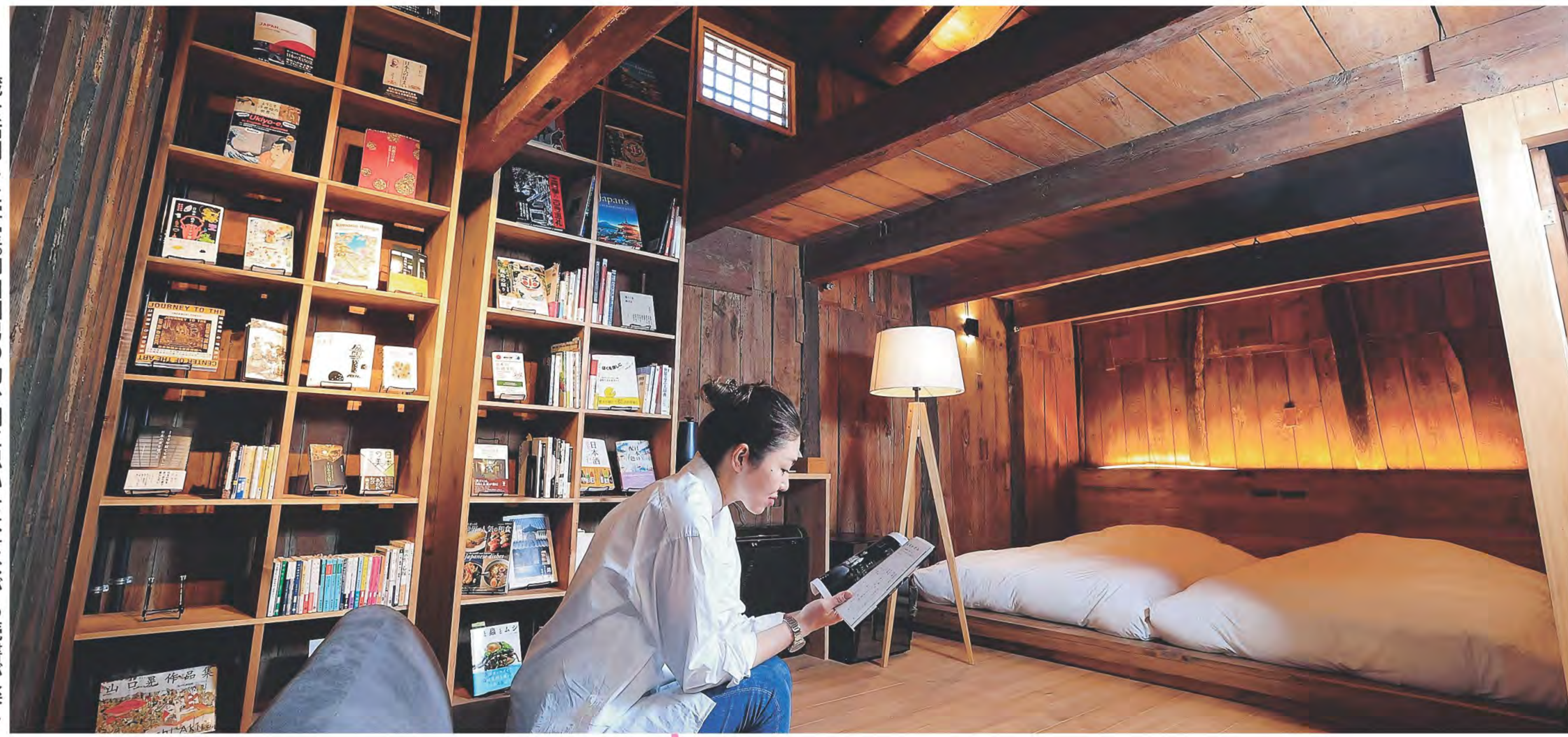
蔵を活用した客室。柳田国男の幼少期に思いをはせながら読書が楽しめる。兵庫県福崎町西田原、NIPPON I A 播磨福崎 蔵書の館